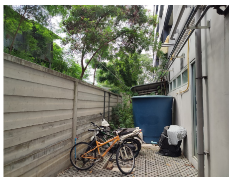
ภาพที่ 4-24 ฝาบ่อน้ำบาดน้ำเสีย ปิดสนิท ถึงสำรองน้ำใช้มีสภาพดี