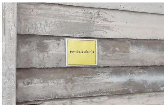
ภาพที่ 4-12 ป้ายห้ามล่าสัตว์ป่า และห้ามรุกพื้นที่ป่า