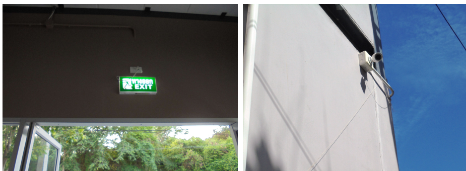
ภาพที่ 4-21 บ้ายทางหนีไฟ และภาพที่ 4-22 กล้องวงจรปิดภายในอาคาร