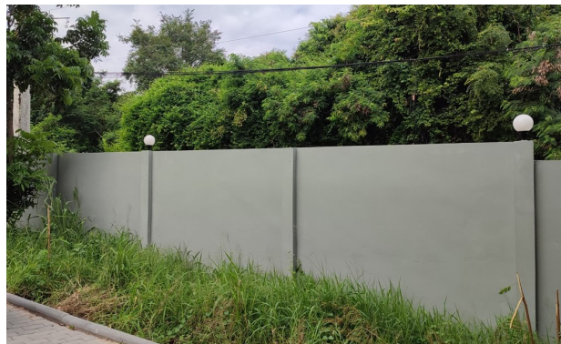
4-20 ไฟส่องสว่างเวลากลางคืนที่รั้วโครงการ