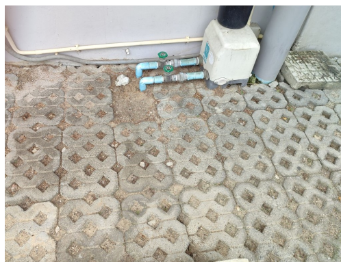
ภาพที่ 4-6 พื้นทางวิ่งรถเป็นบล็อคอูฐน้ำ