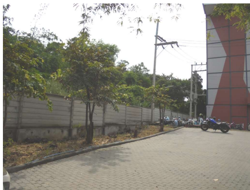
ภาพที่ 4-2 พื้นที่สีเขียว ของโครงการ