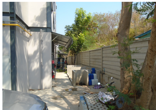
ภาพที่ 4-11 ที่พักมูลฝอยรวมของโครงการ