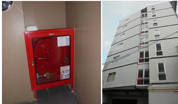
ภาพที่ 4-15 ระบบท่อเย็นและตู้เก็บสายฉีดน้ำดับเพลิงพร้อมอุปกรณ์