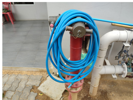
ภาพที่ 4-16 หัวรับน้ำดับเพลิงจากภายนอก