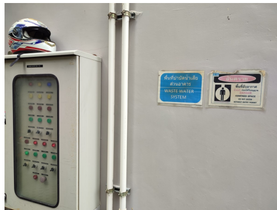
ภาพที่ 4-9 ป้ายบอกบริเวณบ่อบำบัดน้ำเสีย