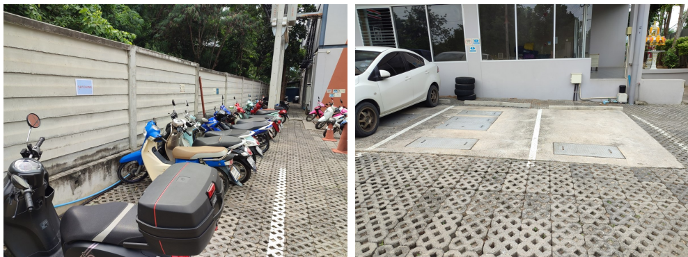
ภาพที่ 4-4 ที่จอดรถยนต์ และรถจักรยานยนต์