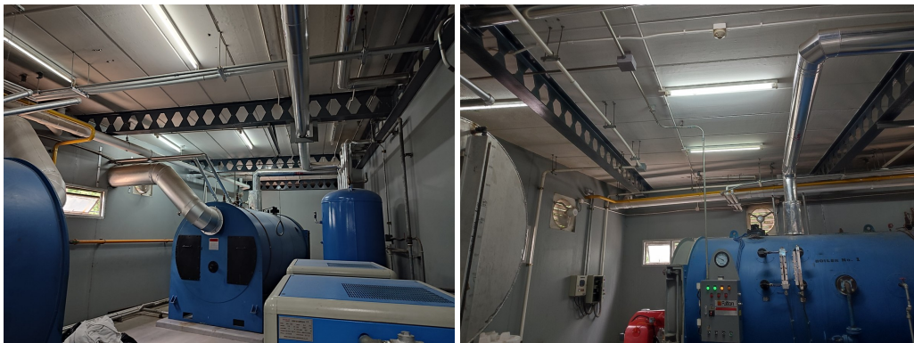
ภาพที่ 4-19 ช่องเปิดระบายอากาศของอาคาร และพัดลมระบายอากาศ และระบบเตือนอัคคีภัย