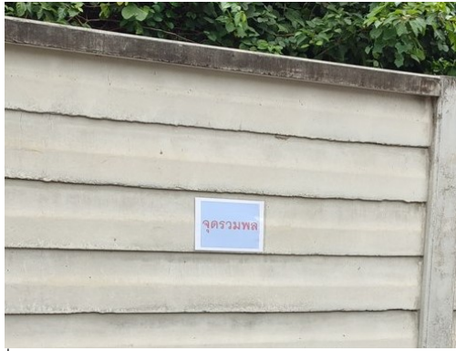
ภาพที่ 4-18 บ้ายจุดรวมพลของโครงการ มีการทำรั้วโครงการซ่อมแซม