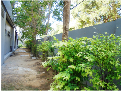
ภาพที่ 4-10 บริเวณที่กำลังกำจัดขยะมีเทนและแอรอซอล