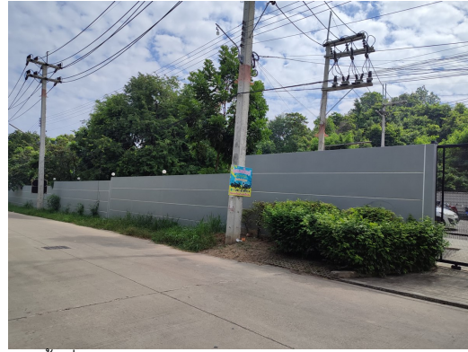
ภาพที่ 4-1 รวบรวมขอบเขตพื้นที่โครงการ