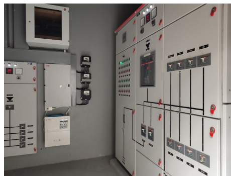
ภาพที่ 4-23 ห้องไฟฟ้าปกติและป้ายเตือนอันตราย