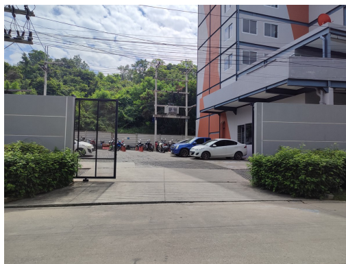
ภาพที่ 4-25 ทางเข้าออกโครงการไม่มีรถจอดกีดขวาง