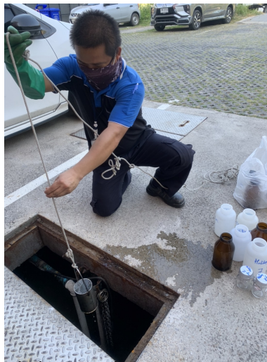
เก็บตัวอย่างน้ำทิ้งที่บ่อกักน้ำหลังออกจากระบบบำบัดน้ำเสีย