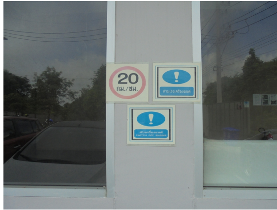
ภาพที่ 4-7 ป้ายห้ามเร่งเครื่องยนต์