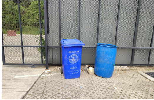
ภาพที่ 4-22 ถังรองรับมูลฝอยภายในโครงการ