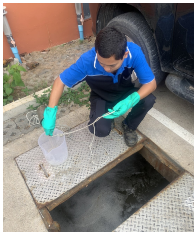
เก็บตัวอย่างน้ำทิ้งที่บ่อดตรวจคุณภาพน้ำทิ้ง